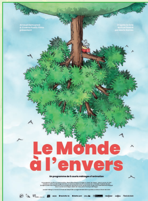
LE MONDE À L'ENVERS

En avant-première, deux programmes de courts métrages français sont proposés. Le Monde à l'envers aborde avec douceur la question de la différence et offre une vision inclusive de l'expérience de certains enfants. Patouille et Momo, Les Contes de la forêt invite à explorer le monde vivant et à découvrir les secrets botaniques les plus fascinants de la nature.